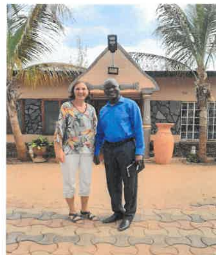
Wilde Ganzen op werkbezoek