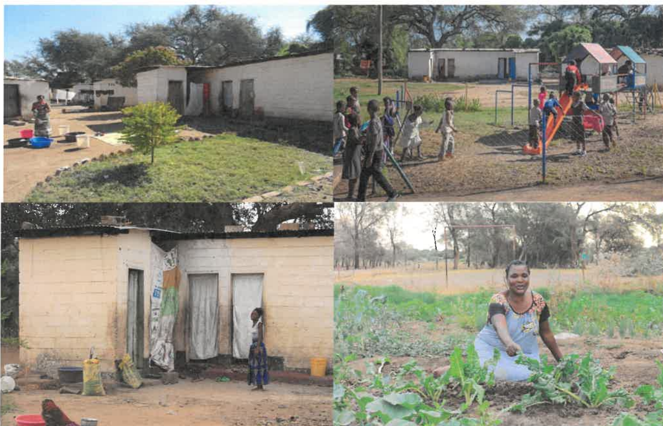
Wonen en leven op de Linda Blind Farm