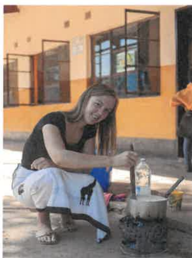
Feline volonteert in de zomer