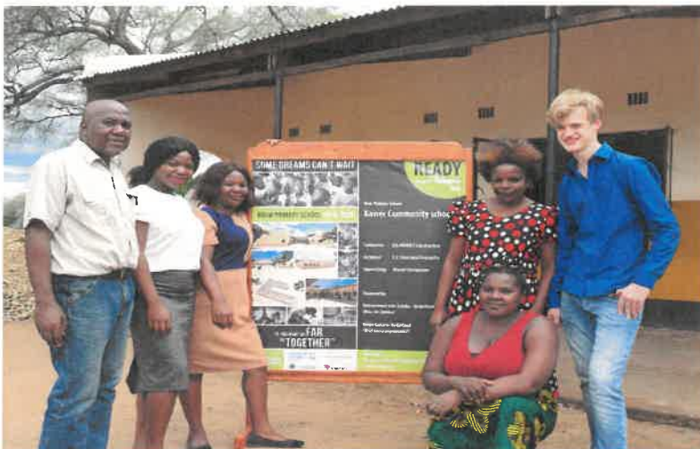
Het fantastische schoolteam 2019.