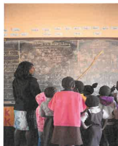
Kinderen op de Linda Blind Farm School in 2019. Wat een immens groot verschil met februari 2014!