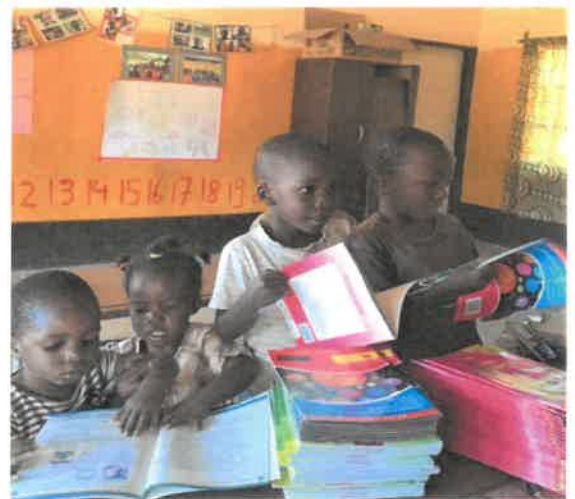
Elk kind een eigen boekenset, ook voor de nieuwe klas.